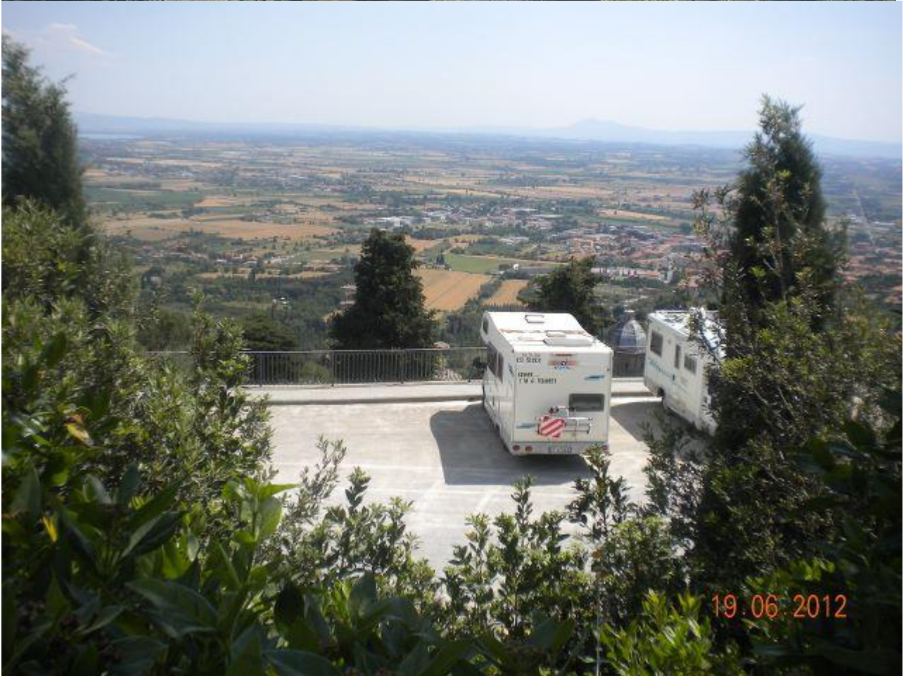
(Quello che si intravede in alto a sinistra è il lago Trasimeno)